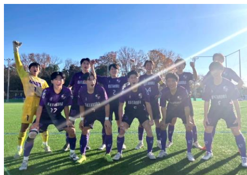
🏆 T5 順位決定戦 vs 正則学園 🏆

12月7日(日)、 T5 順位決定戦第二戦 vs 正則学園 が、日本文化大学(ニチブン)サクラフィールドで行われました。 52 期生(3 年) の高校サッカー公式戦も残り二試合。高校サッカー節目のゲームを三連勝して有終の美を飾りたいものです。対戦相手の正則学園は、一昔前に選手権決勝まで勝ち上がり帝京高校と西が丘で戦ったことのある古豪です。去年の地区トップリーグでも対戦していて、その時はあと一歩及ばず敗れましたが、あの敗戦が昨年度のチームのターニングポイントとなる起爆剤になりました。まさに、敗戦から学です。